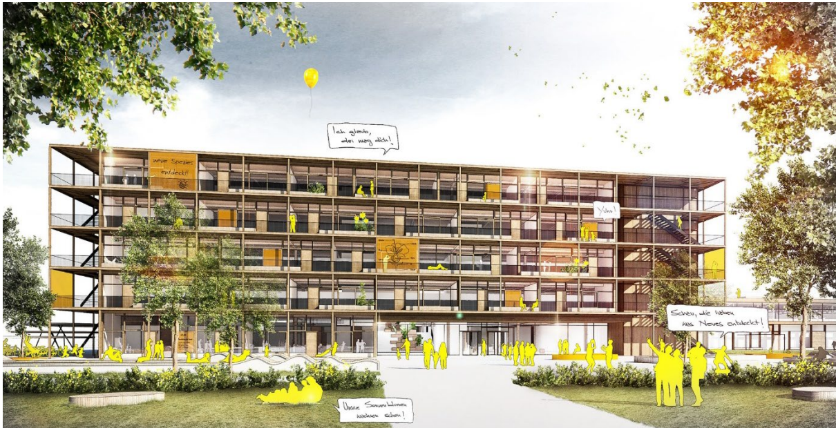
Das geplante neue MBG-Schulgebäude, Quelle: www.competitionline.com

Vielleicht haben Sie bereits gesehen, dass unser altes Schulhaus, die Turnhallen und der ehemalige IZBB-Bau an der Schultheißallee mittlerweile abgerissen sind. An dieser Stelle wird unser neues Schulgebäude zusammen mit einer 7-fach Sporthalle und einer Mensa, die wir zusammen mit dem Neuen Gymnasium nutzen werden, errichtet. Das Gymnasium wird für eine sechs- bis siebenzügige Auslastung geplant. Den international ausgeschriebenen Architektenwettbewerb hat ein Architekturbüro in Wien ( Caramel Architekten ) gewonnen, das derzeit zusammen mit der wbg kommunal , der Stadt und uns im regen Planungsaustausch ist. Der Bezug des neuen Schulgebäudes ist in der aktuellen Planung für das Jahr 2025 vorgesehen.