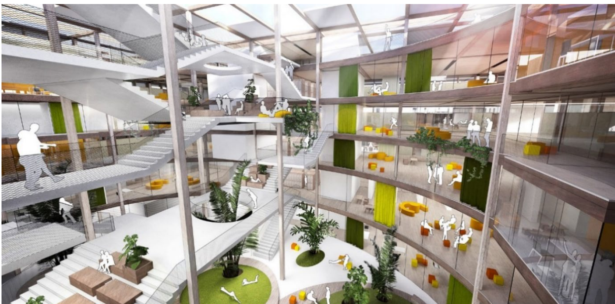
Eindruck vom Inneren des neuen MBG-Schulgebäudes

Vielleicht haben Sie bereits gesehen, dass unser altes Schulhaus, die Turnhallen und der ehemalige IZBB-Bau an der Schultheißallee mittlerweile abgerissen sind. An dieser Stelle wird unser neues Schulgebäude zusammen mit einer 7-fach Sporthalle und einer Mensa, die wir zusammen mit dem Neuen Gymnasium nutzen werden, errichtet. Das Gymnasium wird für eine sechs- bis siebenzügige Auslastung geplant. Den international ausgeschriebenen Architektenwettbewerb hat ein Architekturbüro in Wien ( Caramel Architekten ) gewonnen, das derzeit zusammen mit der wbg kommunal , der Stadt und uns im regen Planungsaustausch ist. Der Bezug des neuen Schulgebäudes ist in der aktuellen Planung für das Jahr 2025 vorgesehen.